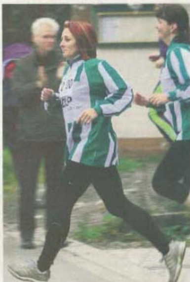
Entlang der Strecke stehen die Zuschauer und feiern die Läufer an. Jeder Läufer kann sich der Unterstützung durch die Fans gewiss sein und das ist eine Motivation mehr am Samstag an den Start zu gehen.