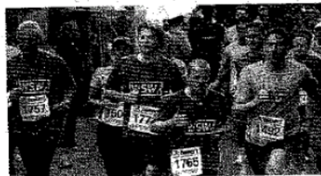
Auch diese Läufer der Stadtwerke hängten sich beim Sambatrasßenlauf voll rein.

777 Läufer von 70 Firmen – darunter auch ein Team der WZ – wurden ab 15.30 Uhr auf die Strecke geschickt. Damit es dort nicht zu viel Gedränge gab, in Portionen und im Minuten-Takt. Zunächst dominierte Grün auf der Strecke, denn das Helios Klinikum hatte 69 Teilnehmer in ihren grünen T-Shirts angeboten – nur noch getoppt von der Banner GEK, die es auf rund 90 Renner brachte. Nicht jeder von denen schlug ein gesundes Tempo an, während umgekehrt etwa bei Audi und Mercedes der ein oder andere Läufer schon mal in den Leerlauf schaltete.