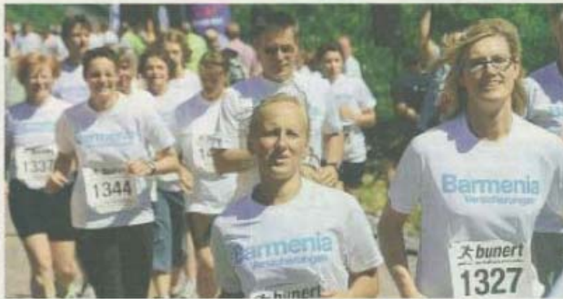
Bei strahlendem Sonnenschein gingen die Läufer im Vorjahr auf die Strecke.

Harzstraße. Los geht es um 13 Uhr mit dem Schülerlauf. Die Strecke ist in diesem Fall 1500 Meter lang. Gewertet wird nach der deutschen Leichtathletik-Ordnung in den Altersklassen Schüler A, B, C und D. Für die Sieger der jeweiligen Altersklassen gibt es Sachpreise. Außerdem erhalten alle Starter eine Urkunde. Der Hauptlauf ist der Adidas Run 10, der um 13.30 Uhr beginnt. Dann gehen Frauen, Männer sowie die weibliche und männliche A- und B-Jugend an der Start. Auch hier warten auf die drei Erstplatzierten aller Altersklassen Sachpreise. Urkunden finden sich im Internet zum Ausdrucken. Der Helios-Run 5 über fünf Kilometer geht um 13.40 Uhr los. Die ersten drei Starter erhalten jeweils einen Sachpreis. Parallel gehen die Nordic Walker auf die Strecke. Diese Aktion hat keinen